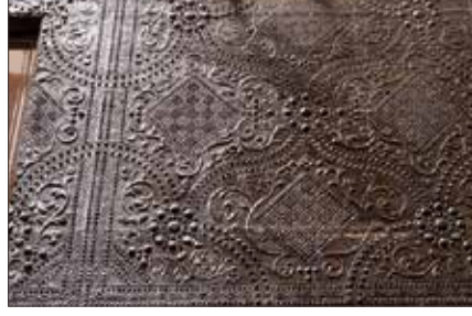
3. Tynecastle Wandtepp- pichtüren