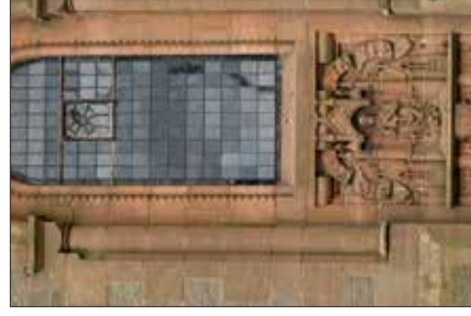
4. Wappen de Stadt