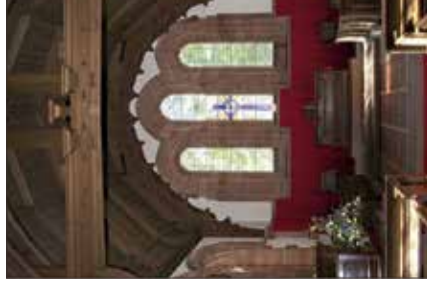
2. Altarraum und Kreuzbalken