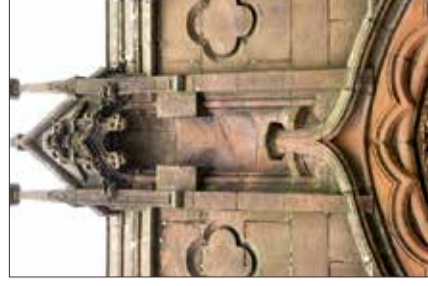
9. Leere Nische