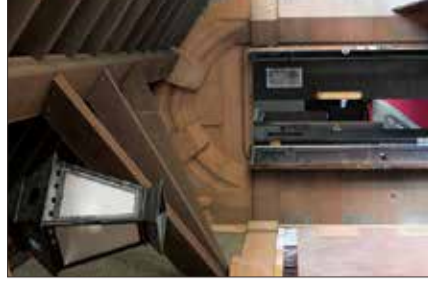
10. Kreuzgang Tür